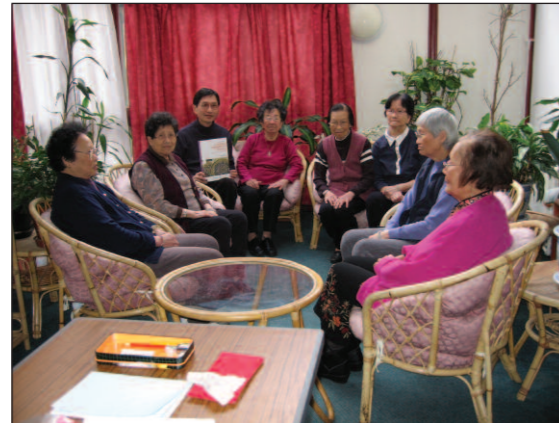
منسقو المشروع يعقدون مناقشات مع مجموعات التركيز